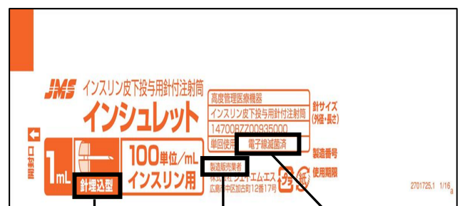
針埋込型 製造販売業者 電子線滅菌済