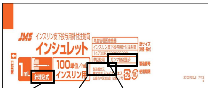
針埋込式 製造販売元 ガンマ線滅菌済