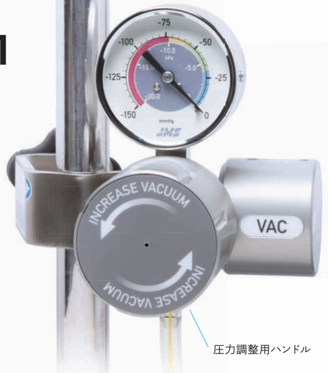
圧力調整用ハンドル