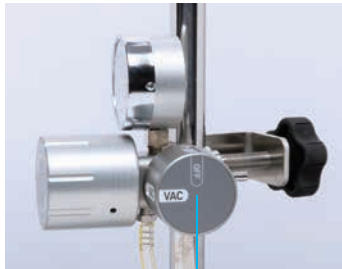
状態変更用ハンドル