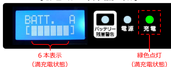
【モジュールユニット天面パネル】

2. 使用前及び点検時にモジュールユニットの内蔵バッテリー残量が満充電状態であることを確認してください。